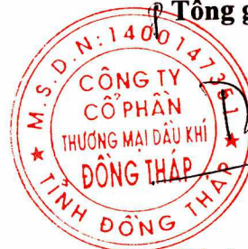
Đinh Thiện Hiền